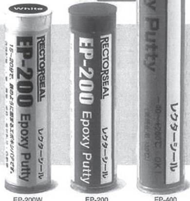
EP-200W EP-200 EP-400