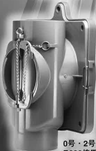
0号・2号・3号 R300楕円・平面用