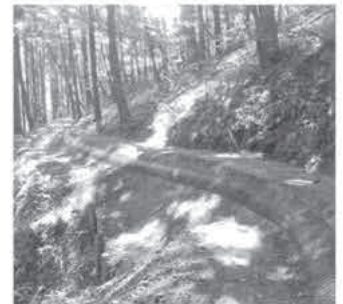
▲中山間農業用水路改修工事 (イメージ)