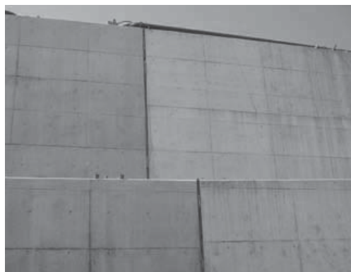
▲地下構造物の目地に使用