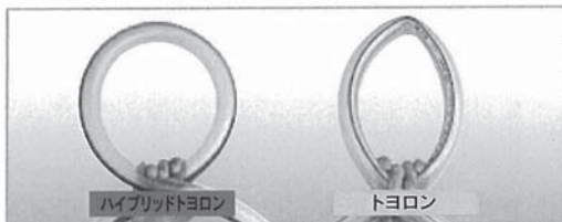
※ ご使用の際は、「安全上のご注意」をよくお読みの上で使用ください。