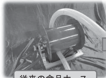
従来の食品ホース

○透明硬質PVCを採用したことにより、従来目視することができなかった硬質PVC下も目視確認できます。異常・コンタミ等の早期発見が容易になります。