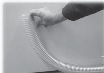
ハンドリングの容易さ 見本