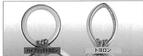
※ ご使用の際は、「安全上のご注意」をよくお読みの上ご使用ください。